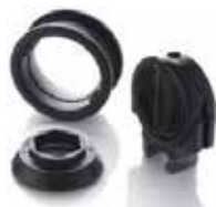
ยางหุ้มวาล์วเปิด ปิดน้ำ