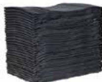
ยางคอมปาวด์